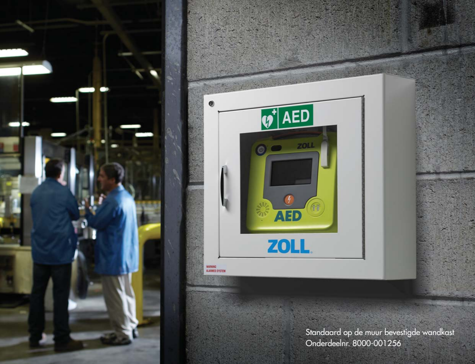
Standaard op de muur bevestigde wandkast Onderdeelnr. 8000-001256