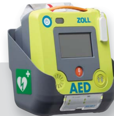
Universeel ophangstelsysteem met ZOLL AED 3 zonder koffertje Onderdeelnr. 8000-001255

In het universele ophangstelsysteem kan de ZOLL AED 3 aan de muur worden bevestigd, met of zonder het bijbehorende koffertje. Op het ophangstelsysteem is het groene AED-symbool van ILCOR aanwezig. Het systeem wordt geleverd met hulpmiddelen voor de bevestiging, een kaart waarop de verbruiksartikelen kunnen worden bijgehouden, een voorbeeld voor de bevestiging en instructies voor het ophangen.