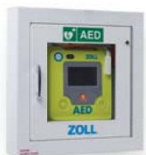
Half ingebouwde wandkast Onderdeelnr. 8000-001257

muur wordt bevestigd, is het eenvoudigst te installeren; de half ingebouwde en volledig ingebouwde modellen steken minder hinderlijk uit. Alle drie de modellen worden geleverd met een set stickers met het ILCOR (International Liaison Committee on Resuscitation) AED-logo en instructies voor de installatie.