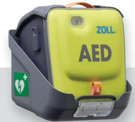
Universeel ophangstelsysteem met ZOLL AED 3 met koffertje en reserveset CPR Uni-padz (in het koffertje) Onderdeelnr. 8000-001266